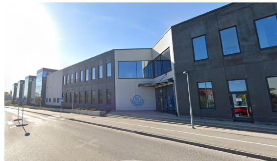
Färg- och materialpalett i det omgivande landskapet. Bilder från Google och Wikipedia.