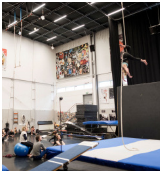
Cirkuseleverna tränar i Cirkus cirkörs träningshall i Alby.