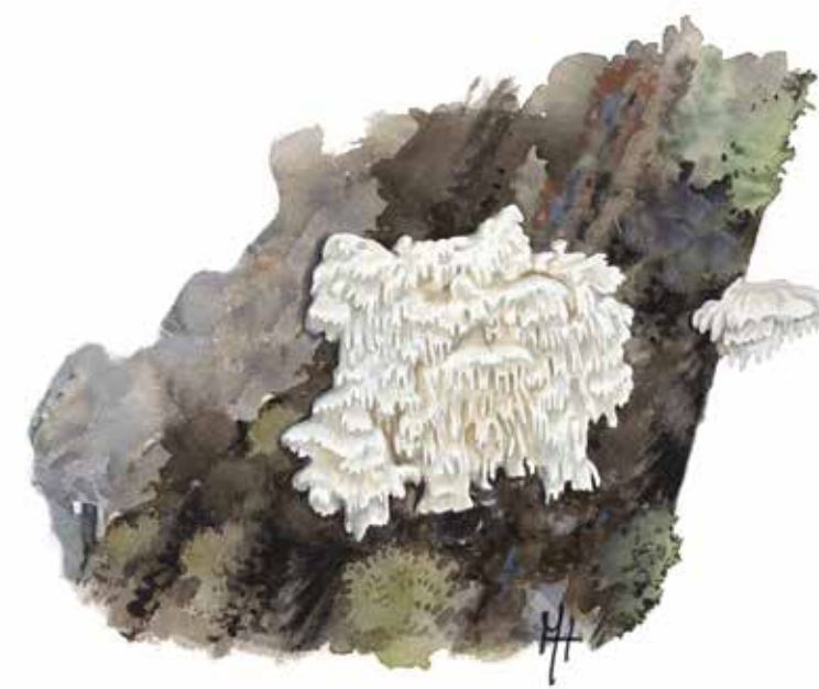
Vintertagging Irpicodon pendulus

Cirka 80 % av reservatets träd är över 90 år gamla. Här finns också träd som är runt 200 år. En del av dessa gamlingar har på ålderns höst rasat omkull och skapat livsmiljöer för mossor, vedsvampar, insekter och fåglar. Den döda veden tillsammans med de gamla träden är nyckeln till en rik mångfald av växter och djur.