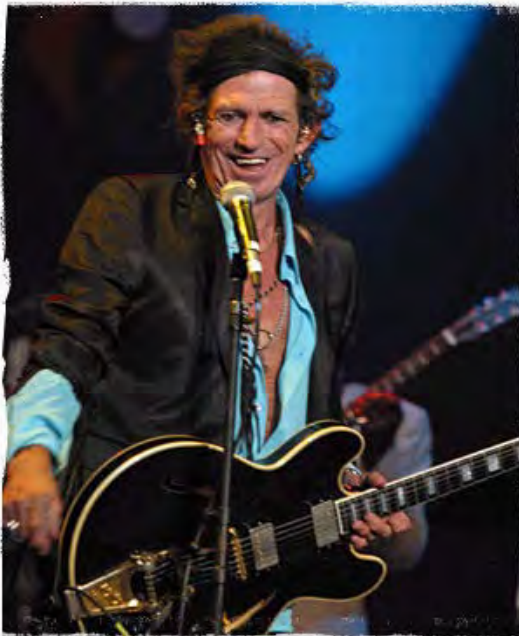
"Make it Funky", Southern Nights New Orleans, April 2004