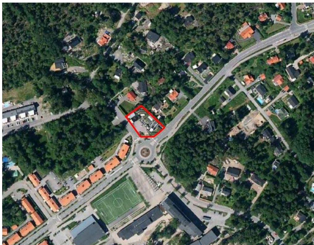
Flygfoto med markerad planområdet.