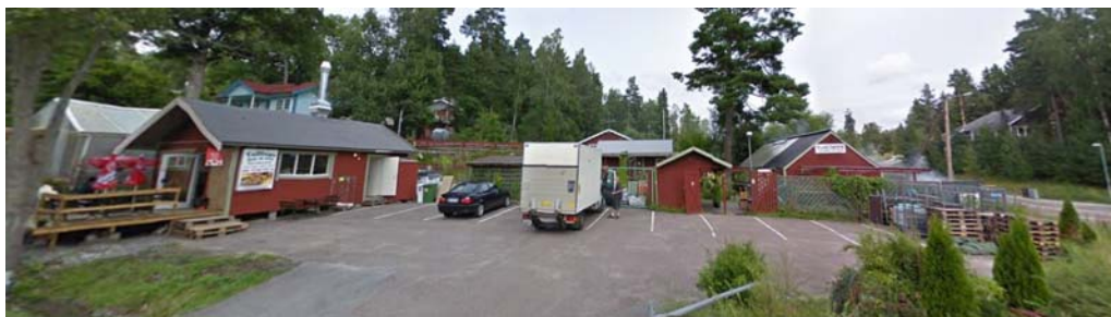
Vy från väster mot restaurang och växthus.

Fastigheten Tullinge 17:129 är en bebyggd fastighet, som huvudsakligen nyttjas för ett trädgårdsmästeri med uthus, planteringar, försäljningslokal och för restaurangändamål. Vid östra gränsen av fastigheten finns en parkeringsplats för verksamheternas besökare och personal. På två sidor inramas tomten av låga buskar och lövträd. På de andra sidorna gränsar den till lokala vägar och en vändplan. Hela tomten sluttar mot söder.