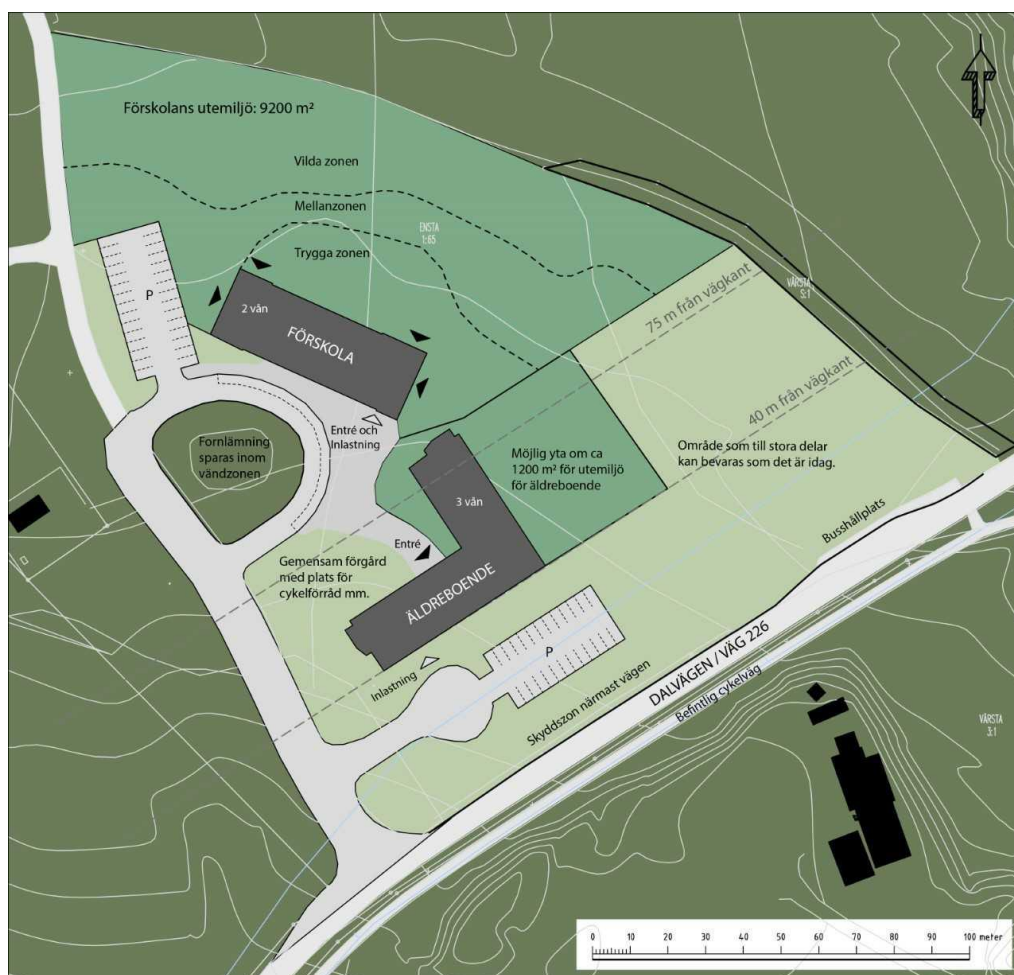
Bild 2. Illustration över hur bebyggelseförslaget skulle kunna se ut.

Byggnaderna placeras i utkanten av den triangulära tomten vilket lämnar en skyddad yta för förskolegården, se bild 2 nedan. Förslaget medger cirka 51 m 2 gårdsyta per förskolebarn enligt förslaget nedan. De två byggnaderna kan komma att sammanbyggas för att samnyttja funktioner som inlastning och kök. Befintlig naturmiljö och träd kan bevaras och integreras med förskolans utemiljö för att undvika onödig avverkning och höja kvaliteten på utemiljön.