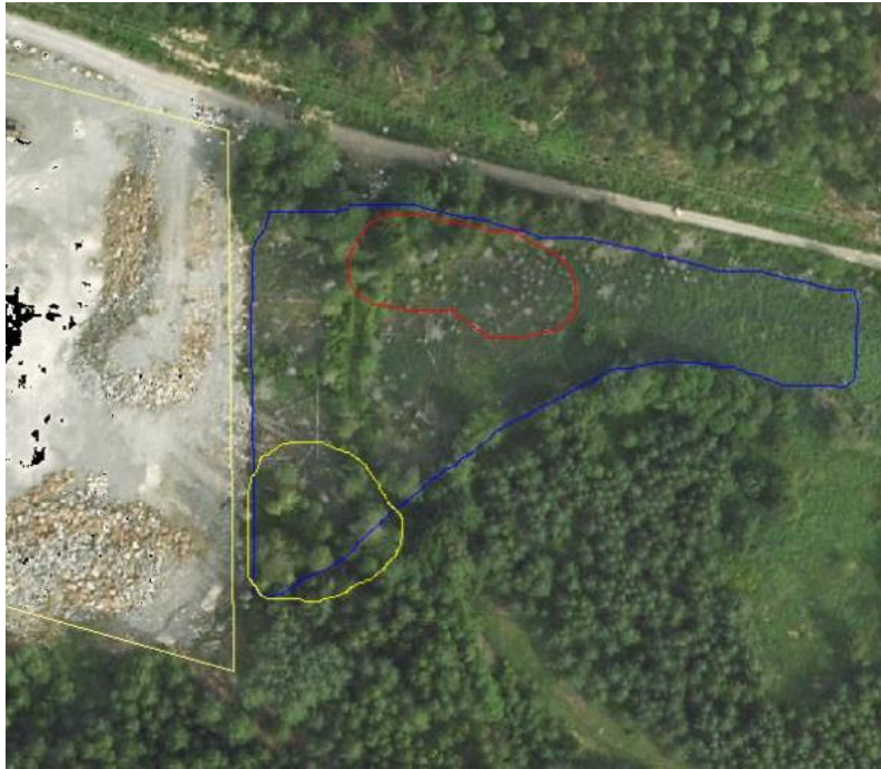
Flygbild över groddjurslokalen (inringad av blå linje) öster om planområdet. Ungefärlig utbredning av föreslagen urgrävning (inringad av röd linje) och av träd som föreslås avverkas (inringad av gul linje).