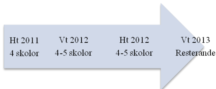
Figur 3: Spår 2 (Unikum)

Utifrån den stegvisa modellen får varje skola i spår 1 få dessutom en individuellt anpassad införandeplan.