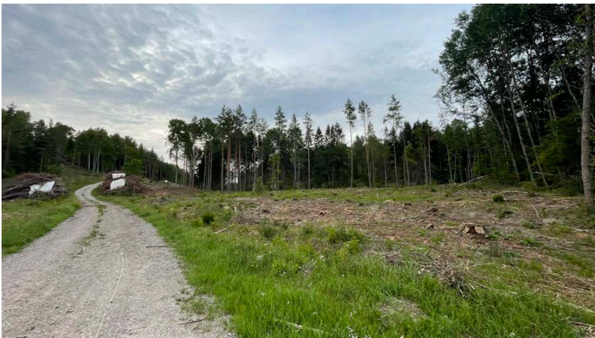
Figur 2. Själva detaljplaneområdet är till största delen nyligen avverkat. Runt området kantar gran och tallskog med inslag av lövträd såsom asp, björk och hassel. Centralt i området finns en mindre sumpskog med klibbal.