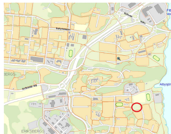
Översiktskarta, planområde markerat i rött

GRUNDKARTA Koordinatsystem SWEREF 99 18 00 Höjdsystem RH00 måtklass II Grundkartan upprättad i maj månad 2013 genom utdrag ur kommunens kartbas Grundkartan utanför planområdet är ej fältkontrollerad