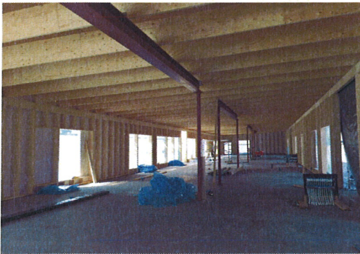
Stomme Hus A