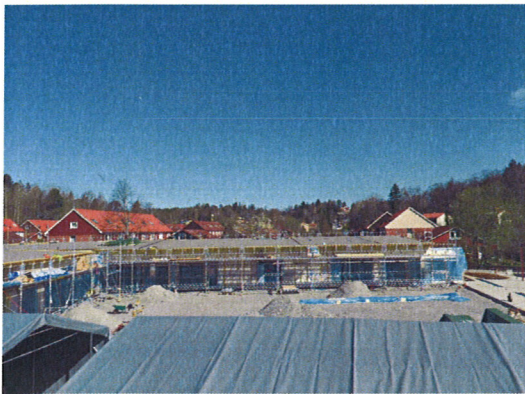
Vy mot Hus A och D