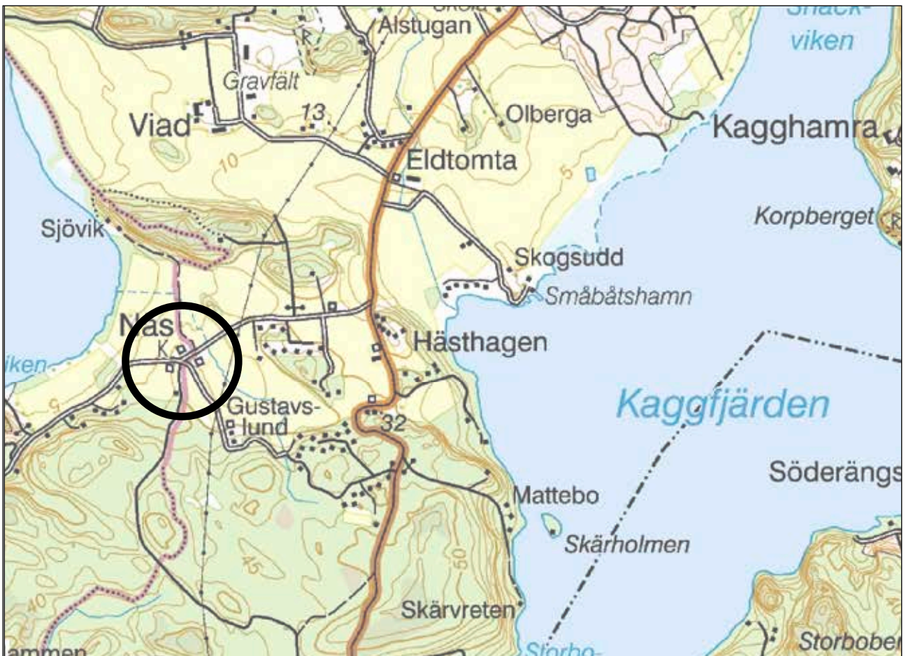
Fig 1. Utredningsobjektets läge markerad på Terrängkartan, skala 1:25 000.