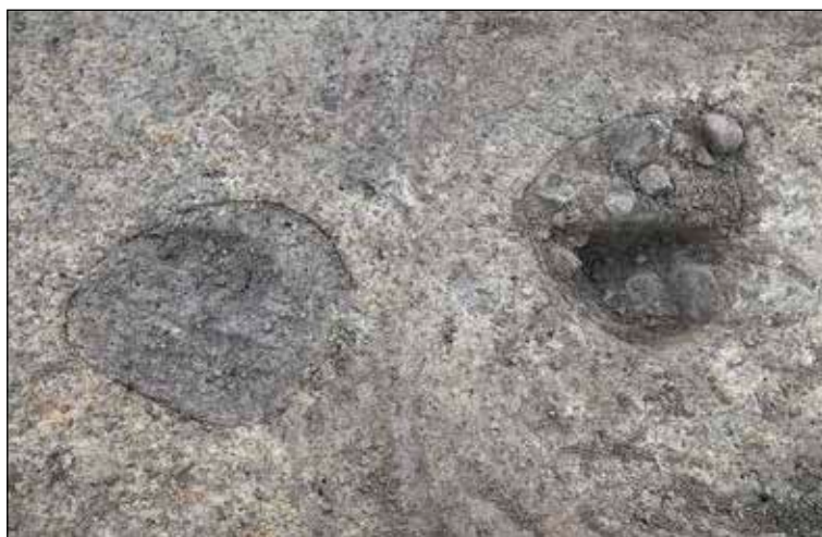
Stolphål A3 till höger i bild och nedgrävning A4 till vänster.