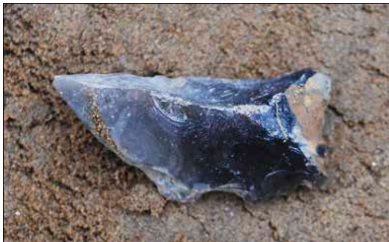
Flinta med kross/nagg på kanterna. Den bedöms kunna vara en eldslagningsflinta.