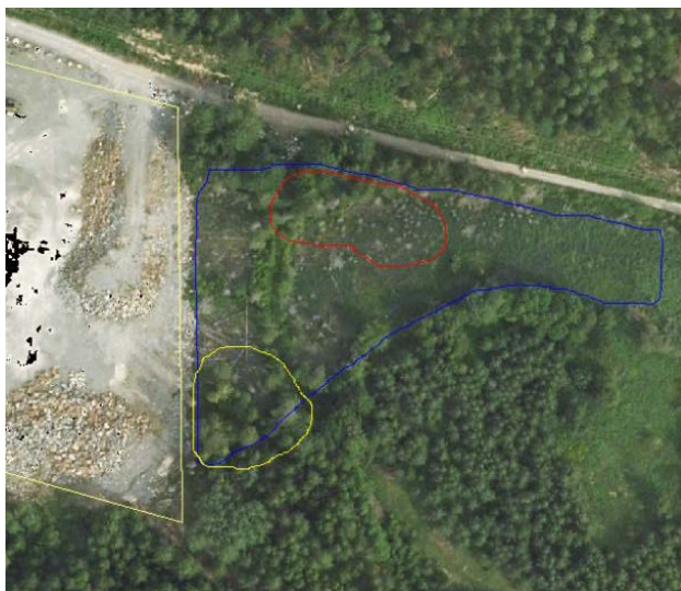
Flygbild över groddjurslokalen (inringad av blå linje) öster om planområdet. Ungefärlig utbredning av föreslagen urgrävning (inringad av röd linje) och av träd som föreslås avverkas (inringad av gul linje).

Kring de plana ytorna finns uppvuxen skog och i diken och sankområden förekommer salamandrar enligt en groddjursinventering som genomförts våren 2007 (sammanfattning i bilaga). Länsstyrelsen har den 17 juni 2009 yttrat sig i samråd enligt 12 kap. 6§ miljöbalken angående större vattensalamander i området. Länsstyrelsen bedömde att nedanstående åtgärder innebär att salamanderns reproduktionsförutsättningar i området totalt sett stärks. Området ligger utanför föreslagen detaljplan.