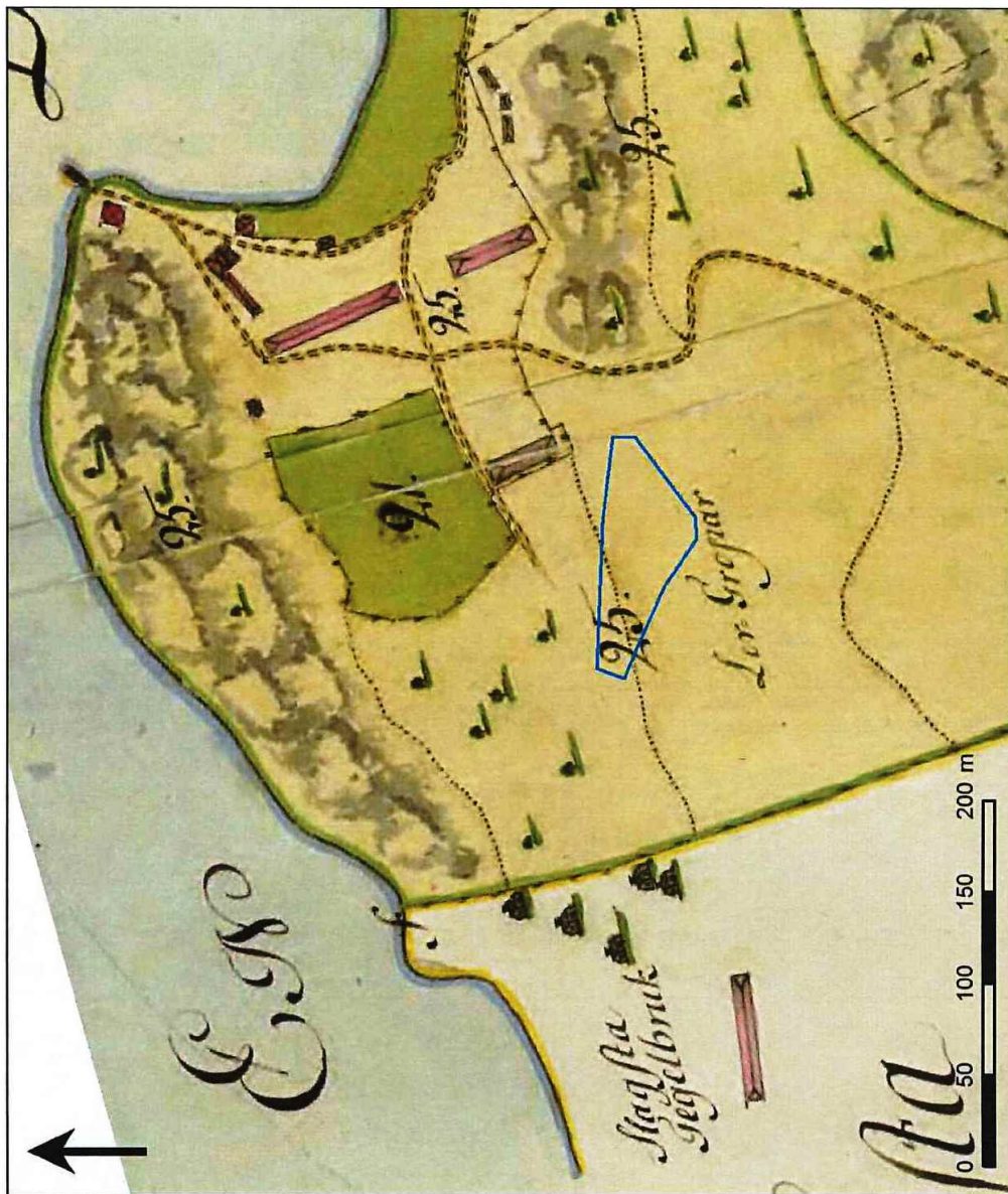
Figur 5. Utsnitt ur storskiffeskartan från 1780 över Fittja (akt A9-6:1). Den blå linjen visar läget för undersökningsområdet. Skala 1:5 000.