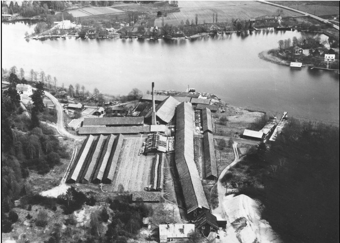
Fig 3. Flygbild över Fittja tegelbruk (år 1946). I förgrunden ses torkklador för tegel, i mitten av anläggningen ses skorstenen där tegelugnen sannolikt var belägen.

Enligt Länsstyrelsens Mifo-underlag var tegelbruket i drift ca år 1861-1962 och produktionen uppgick till ca 2 milj. tegelsten/år. Verksamheten är endast inventerad och prel är området placerat i prel riskklass 4 enligt BKL (låg risk/prioritet för undersökning/inventering).