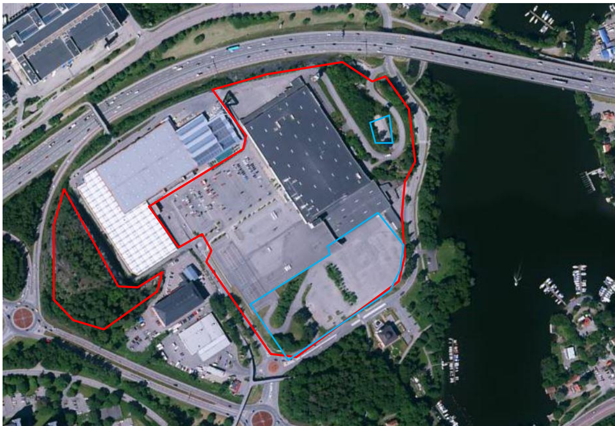
Fig 1. Fastigheten Tegelbruket 1 är ovan markerad med röd heldragen linje (ungefärlig utbredning) och utgörs av 2 st delar. Ungefärlig utbredning av undersökta områden i aktuell undersökning markerat med blå streckning.

Nu genomförd undersökning syftar till att utreda om eventuella föroreningar i mark- och grundvatten på området kan innebära att sanering eller om andra åtgärder behöver vidtas innan alternativt i samband med kommande markarbeten inom planområdet.