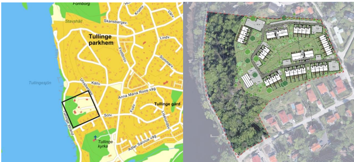
Figur 1. T.h, översiktsbild, aktuellt område markerad med svart ruta. T.v, planerad exploatering med detaljplansgräns.

Radonundersökning utföres i samband med den geotekniska undersökningen och redovisas separat i Geosigma rapport nr 17288 "PM Radonriskundersökning, Ulfbergsgården, Tullinge".