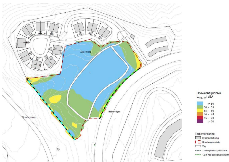
Figur 1 – Förslag på bullerskyddsåtgärder från bullerutredning.

I utredningen föreslås att två bullerskyddsskärmar sätts upp, en längs med Harbrovägen och en längs med Storvretsvägen, se figur 1. I förslaget till detaljplan finns skyddsbestämmelser i form av bestämmelsen (m) i enlighet med rekommendationerna i bullerutredningen. Även på den mark som inte får förses med byggnad (prickad mark) får bullerskydd uppföras. Bullerskydden bör vara genomskinliga för att minska skyddets visuella intrång på omgivningen. I plankartan finns även en bestämmelse om att skolgården ska uppnå riktvärden från Naturvårdsverkets vägledning.