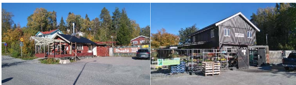
Vy från väster mot restaurang och Plantshopen.

Fastigheten Tullinge 17:129 är en bebyggd fastighet, som huvudsakligen nyttjas för ett trädgårdsmästeri med uthus, planteringar, försäljningslokal och för restaurangändamål. Vid västra gränsen av fastigheten finns en parkeringsplats för verksamheternas besökare och personal. På två sidor inramas tomten av låga buskar och lövträd. På de andra sidorna gränsar den till lokala vägar och en vändplan. Hela tomten sluttar mot söder.