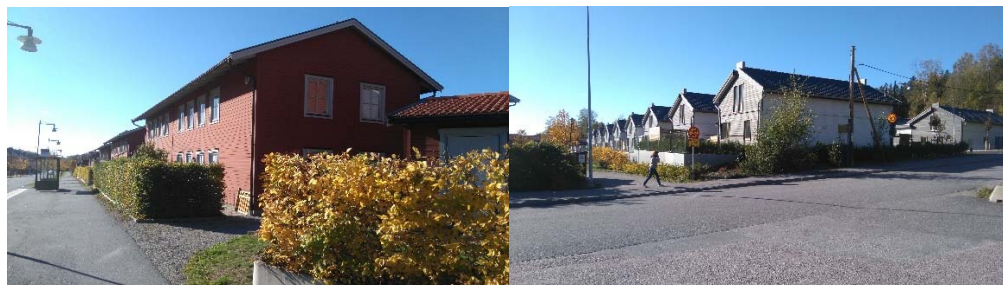
Vy mot moderna bostadshus på andra sidan av Oxelvägen.

Stads- och landskapsbilden förväntas inte förändras nämnvärt. Planområdet ligger i en lågpunkt. I närområdet i norr finns flera höjdryggar vilka förstärker stads- och landskapsbilden.