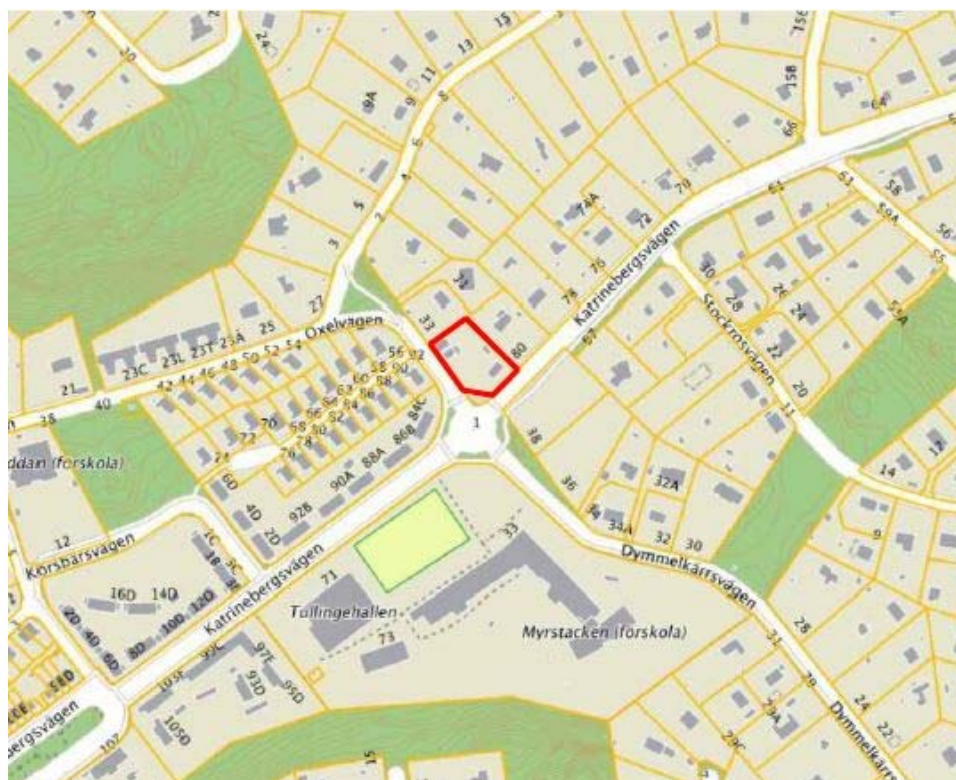
Översiktbild med markerat planområde.