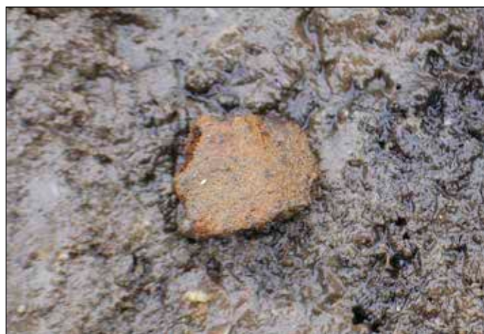
Fig 5. En skärva förhistorisk keramik (ca 1 x 1 cm stor) från nedgrävningen A6.

utgjordes av ett ca 0,25 - 0,3 meter tjockt lager av brun myllig sand (odlingslager) ovan undergrunden av sand eller - i några få schakt - av mo eller morän. Ställvis fanns även berg och/eller jordfasta större stenar/block