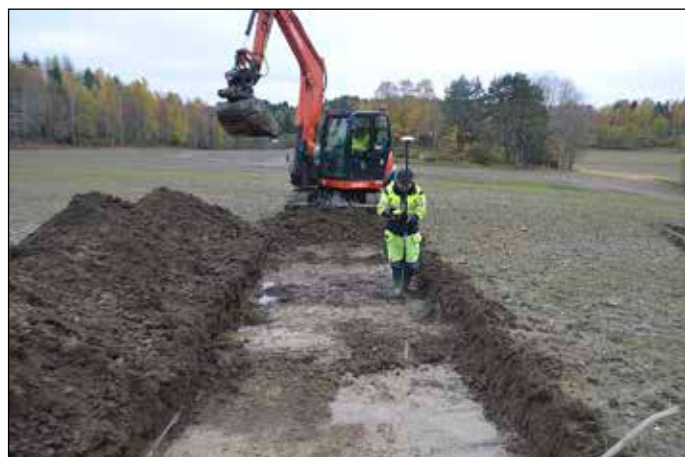
Fig 4. Nedgrävningen A6 i schakt S12 mäts in. Foto från norr.

i botten. I några av schakten förekom skärviga och eller skörbrända stenar, enstaka tegelfragment och/eller någon enstaka skärva av yngre rödgods eller flintgods i fyllningen. Förhistoriska anläggningar och/eller lager framkom i fyra schakt (S4/A1 och A2, S7/A3, S9/A4 och A5 samt S12/A6, se bilaga 1 och 2 samt figur 3 och 4). Lämningarna utgjordes dels av två härdgropar (A2 och A4), två nedgrävningar med oklar funktion (A1 och