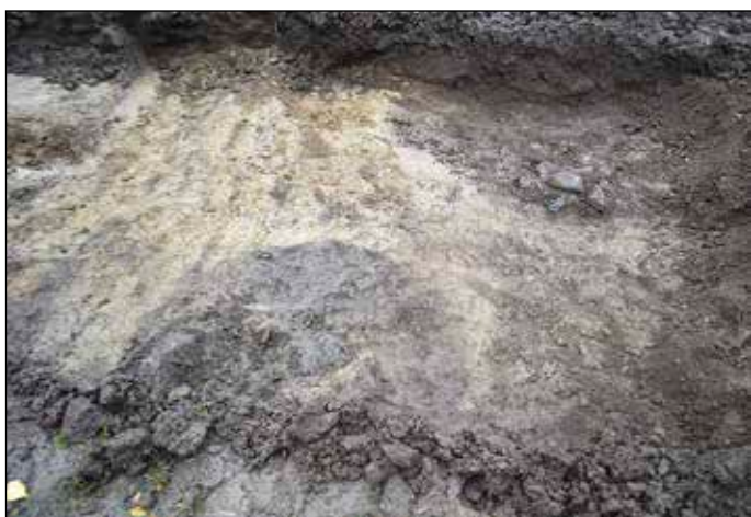
Fig 3. Anläggningarna A1 (närmast i bild) och A2 i schakt S4. Foto från väster.

utgjordes av ett ca 0,25 - 0,3 meter tjockt lager av brun myllig sand (odlingslager) ovan undergrunden av sand eller - i några få schakt - av mo eller morän. Ställvis fanns även berg och/eller jordfasta större stenar/block